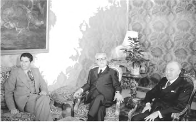
أثناء زيارة عبد السلام جلود لقصر الكويرناله بروما، وجانب من لقاءه الرئيس الإيطالي جيوفاني ليوني، إيطاليا، 1974 / 2 / 23 .